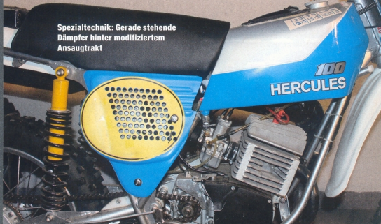
Spezialtechnik: Gerade stehende Dämpfer hinter modifiziertem Ansaugtrakt